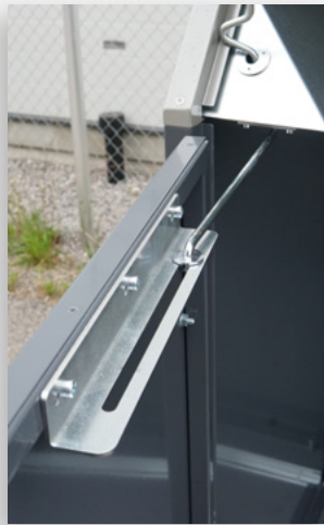
Rajoitin estää oven liiallisen aukeamisen