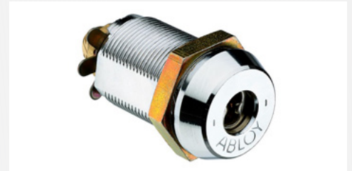
Lisävarusteena sarjoitettava Abloy lukko