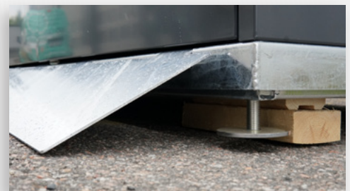
Edessä vahva luiska esteetöntä tyhjennystä varten

TYYLIKKYYS YHDISTETTYNÄ TOIMINNALLISUUTEEN