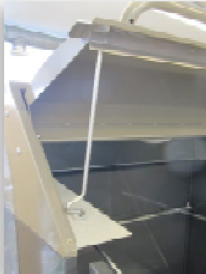
Huollon yhteydessä kansi pysyy auki kansipidikkeellä