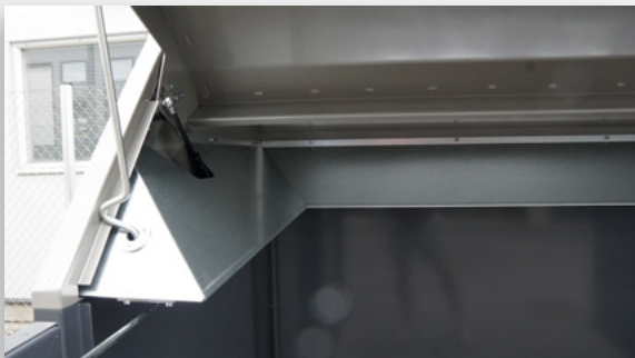
Sisäosassa ohjaimet, joiden avulla roskat menevät aina säiliöön