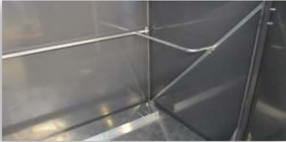
Sisällä olevat ohjaustangot suuntaavat keräysastian oikein

TOIMINNALLISUUS on varmistettu monilla teknisillä ominaisuuksilla, jotka on kehitetty yhteistyössä jätehuoltoyhtiön kanssa. Jätteen käsittely edellyttää, että jäteastiasuoja kestää rankkaakin käyttöä.