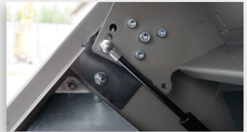
Kaasujouset vaimentavat kannen sulkeutumista tuulisella säällä