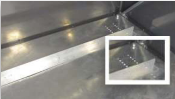
Lattiasa oleva stopperi voidaan helposti asentaa keräysastiatyyppin mukaan