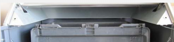
Sisällä olevat ohjauspaneelit kohdistavat jätteet keräysastiaan